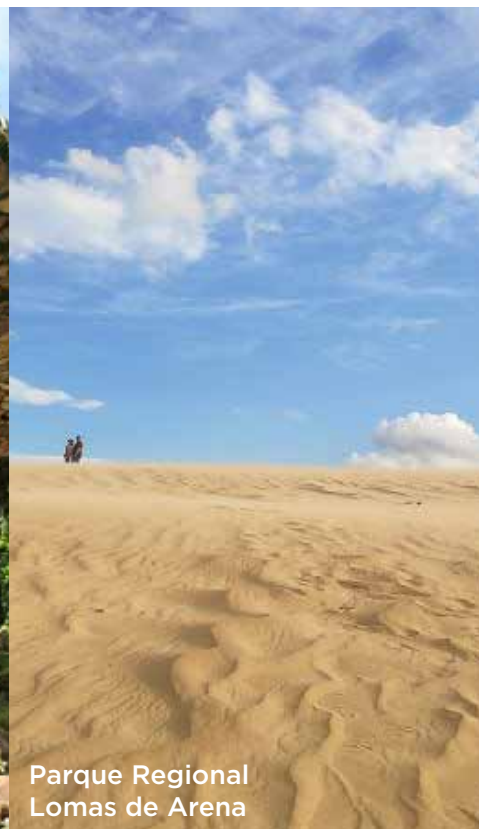
Parque Regional Lomas de Arena