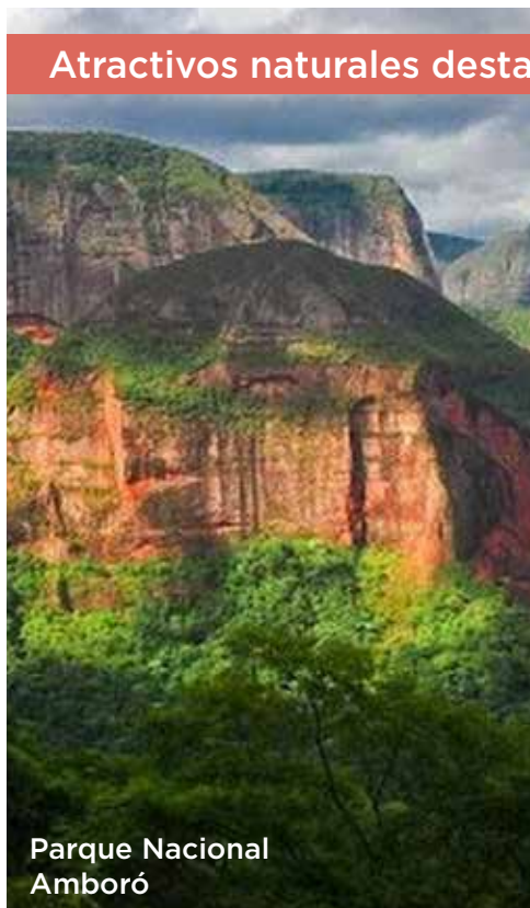
Parque Nacional Amboró